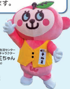
青森県消費生活センター マスコットキャラクター テルミちゃん (Tel. Me)