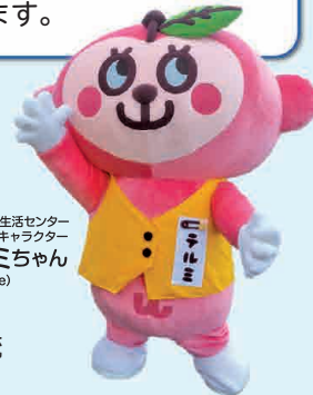
青森県消費生活センター マスコットキャラクター テルミちゃん (Tel. Me)